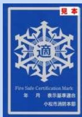
表示マーク銀（有効期限1年）

表示マークには、金と銀の2種類があります。審査した結果、表示基準に適合していることが認められた場合には、建物の関係者に「表示マーク(銀)」を交付します。3年間連続して表示基準に適合していると認められる場合は「表示マーク(金)」が交付されます。なお、表示マークを建物に掲出するほか、ホームページ等に表示マークを掲出することができます。