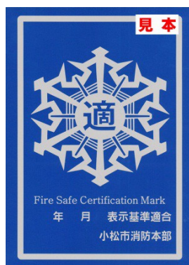
表示マーク銀（有効期限 1 年）

審査した結果、表示基準に適合していることが認められた場合には、建物の関係者に「表示マーク（銀）」を交付します。3 年間連続して表示基準に適合していると認められる場合は、「表示マーク（金）」が交付されます。なお、表示マークを建物に掲出するほか、ホームページ等に表示マークを掲出することができます。