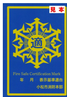
表示マーク金（有効期限 3 年）